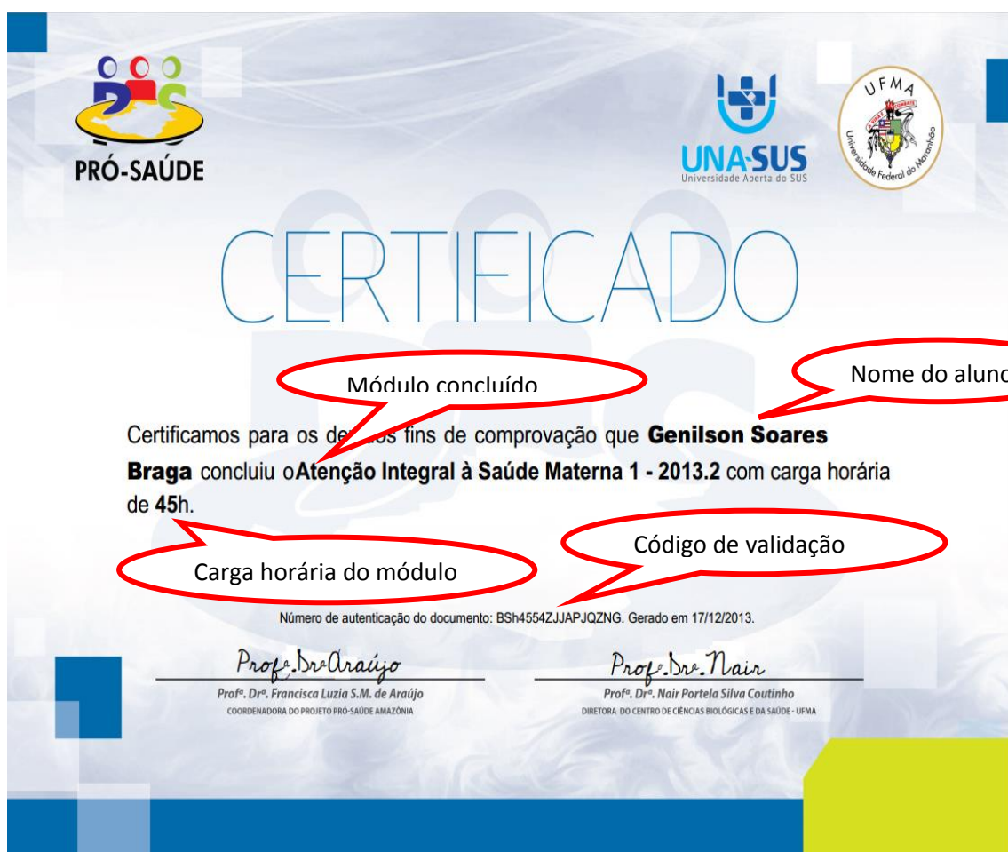
Figura 3 – Modelo de certificado.

Caso o código seja validado com sucesso será mostrado o certificado correspondente ao código especificado para verificação assim como visto na Figura 3.